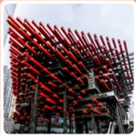
ตึกตะเกียบ