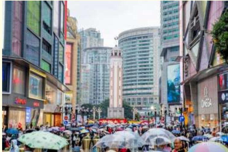
ถนนคนเดินเจี๋ยฟางเป่ย์

และนำท่านไป ถนนคนเดินเจี๋ยฟางเป่ย์ (Jiefangbei Street) ตั้งอยู่บริเวณอนุสาวรีย์ปลดแอก ซึ่งสร้างขึ้นเพื่อรำลึกถึงชัยชนะในการทำสงครามกับญี่ปุ่น แต่ปัจจุบันกลายเป็นศูนย์กลางทางการค้าขนาดใหญ่ ใจกลางเมือง เต็มไปด้วยร้านค้ามากกว่า 3,000 ร้าน ซึ่งมีทั้งอาหาร ซ้อปิ้ง มอลล์ขนาดใหญ่ ให้ท่านได้เดินชมและซ้อปิ้งกันอย่างจุใจ.