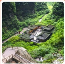
หลุมบ่อฟ้า