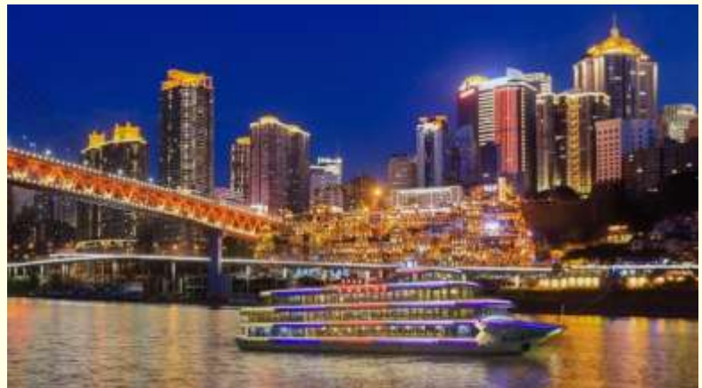
Option เสริม ล่องเรือราตรีชมแม่น้ำสองสาย

*ราคาทัวร์นี้ยังไม่รวมค่าบริการค่าล่องเรือ สำหรับท่านที่สนใจจะมีค่าบริการท่านละ 300 หยวน (ราคาอาจมีการเปลี่ยนแปลง กรุณาตรวจสอบราคาก่อนซื้ออีกครั้ง)*