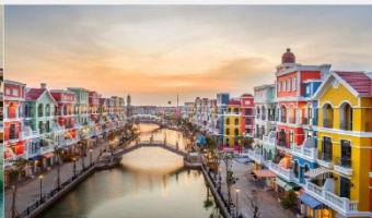
แกรนด์เวิลด์ฟู้ท๊วก