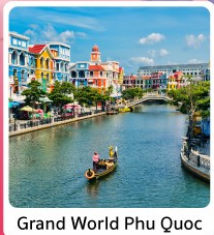
Grand World Phu Quoc