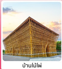
บ้านไม้ไผ่

ไอโวลท์ เทียวครบ สวนน้ำ Aquatopia & สวนสนุก Vin Wonder เวนิสแห่งเวียดนาม Grand World Phu Quoc แลนด์มาร์คสุดโรแมนติก