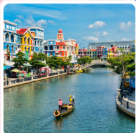
Grand World Phu Quoc