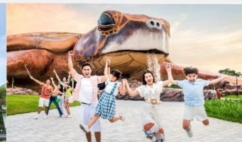
วินเพิร์ล อควาเรียม

*ทางบริษัทฯ ขอสงวนสิทธิ์ในการสลับโปรแกรมทัวร์ตามความเหมาะสมขึ้นอยู่กับสถานการณ์หน้างาน โดยคำนึงถึงผลประโยชน์ของลูกค้าเป็นสำคัญ