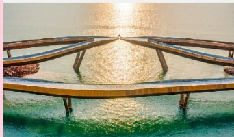
สะพานจูป