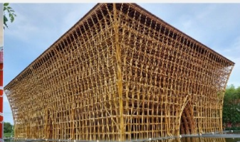
บ้านไม้ไฟ