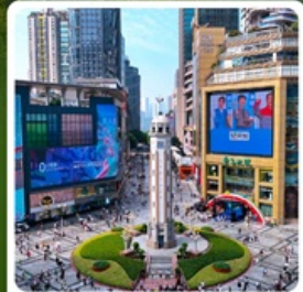
ถนนเจียฟางเป่ย์