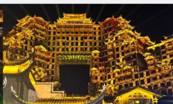
ตีทมหัทศวรรษ 72