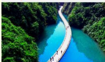
ขุนเขาสิงโต