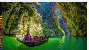
แกรนด์แคนยอนผิงซาน

*ทางบริษัทฯ ขอสงวนสิทธิ์ในการสลับโปรแกรมทัวร์ตามความเหมาะสมขึ้นอยู่กับสถานการณ์หน้างาน โดยคำนึงถึงผลประโยชน์ของลูกค้าเป็นสำคัญ