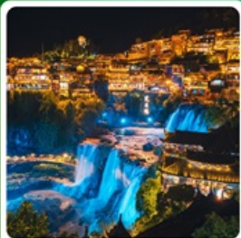
ฟูรงเจิน