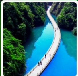
คุนเขาสิงโต