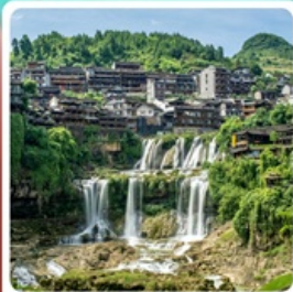
ฟูหลงเจิน

• ไฮโล่ อุกยานเทียนเหมินซาน ชมประตูสวรรค์ หุบเขาอวตาร หมู่บ้านโบราณฟูหลงเจิน และเฟื่องหวง ล่องเรือทะเลสาบเป่าเฟื่องหู