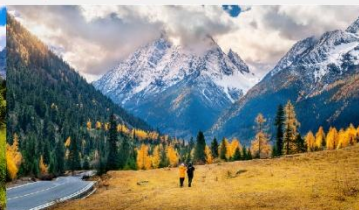
ภูเขาสี่ดรุณี (หุบเขาชวงเฉียวโกว)