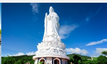
วัดลินฮิ่ง