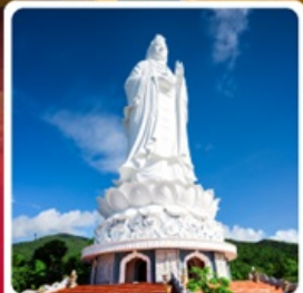
วัดลินฮ้าง

• ไอล็อต นั่งกระเช้าขึ้นยอดเขาบานาฮิลล์ ชมเมืองโบราณฮอยอัน ลักการะเจ้าแม่กวนอิม