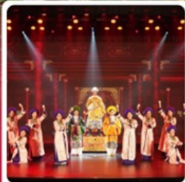
The Heritage Show