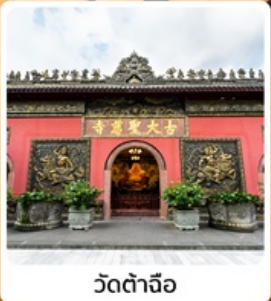
วัดต้าเจี๋ย