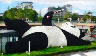
รูปปั้นหมีแพนด้าอนเซลฟี่