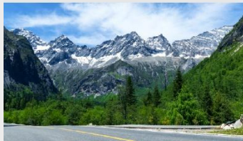
ภูเขาสี่ดรุณี (หุบเขาชวงเจียวโกว)