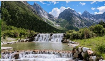
อุทยานแห่งชาติปี่เฟิงโกว