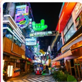
ถนนคนเดินซิงหยุน