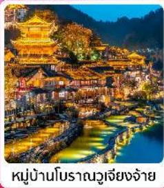
หมู่บ้านโบราณวูเจียงจ้าย