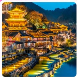
หมู่บ้านโบราณวูเจียงจ้าย