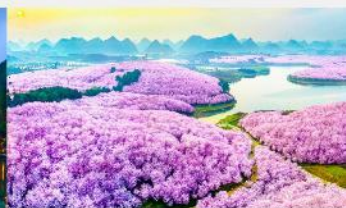
ชากระฝิงป้า

*ทางบริษัทฯ ขอสงวนสิทธิ์ในการสลับโปรแกรมทัวร์ตามความเหมาะสมขึ้นอยู่กับสถานการณ์หน้างาน โดยคำนึงถึงผลประโยชน์ของลูกค้าเป็นสำคัญ