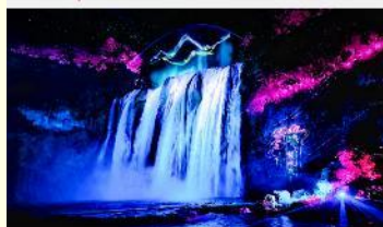
อุทยานน้ำตกหวงกั๋วซู่