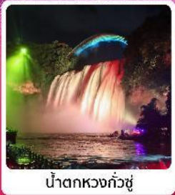
น้ำตกหวงกั๋วซู