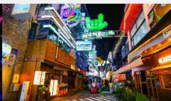
ถนนคนเดินซิงหยุน