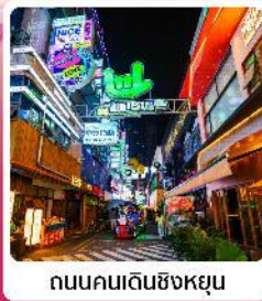
ถนนคนเดินซิงหยุน

• โฮเทล ส่วนชากระผิงปา หนึ่งในสถานที่ชมดอกชากระที่ใหญ่ที่สุดในโลก น้ำตกสวยระดับ 5A น้ำตกหวงกั๋วซู หมู่บ้านจีนโบราณ วูเจียงจ้าย