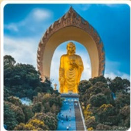
พระใหญ่ตงหลิน