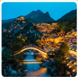
หุบเขาวังเซียนกู่