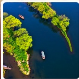
อ่าวพระจันทร์