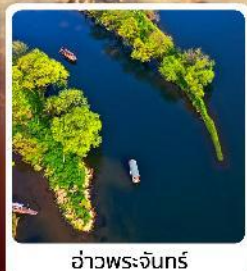
อ่าวพระจันทร์

• ไโอไทร์ เช็คอิน ลั่วซิงตุน หอคอยดาวตกแห่งเจียงซี คุบเขาวังเซียนกู่ ดินแดนสวยดุจเทพนิยาย