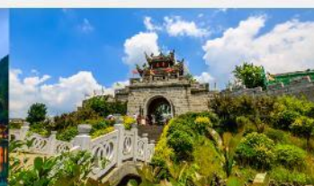
เมืองโบราณซิงเหยียน

*ทางบริษัทฯ ขอสงวนสิทธิ์ในการสลับโปรแกรมทัวร์ตามความเหมาะสมขึ้นอยู่กับสถานการณ์หน้างาน โดยคำนึงถึงผลประโยชน์ของลูกค้าเป็นสำคัญ