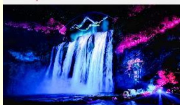
อุทยานน้ำตกหวงกั๋วซู่