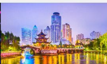
หอเจี่ยเซียวโหลว