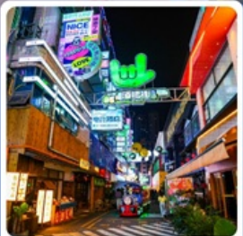
ถนนคนเดินซินเหยียน