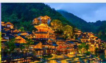
หมู่บ้านโบราณวูเจียงจ้าย