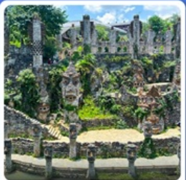
ปราสาทหินเย่หลางกู่