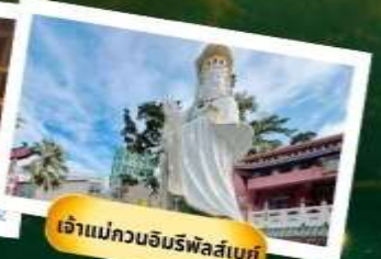
เจ้าแม่กวนอิมรฟัสไซเบย์