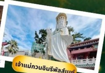
เจ้าแม่กวนอิมริฟัสเบย์