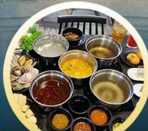
ชาบูฮ่องกง

02-04 มิ.ย. 18-20 มิ.ย. 07-09 มิ.ย. 20-22 มิ.ย. 13-15 มิ.ย. 25-27 มิ.ย. 14-16 มิ.ย. 28-30 มิ.ย.