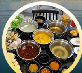
ชาบูฮ่องกง

02-04 มิ.ย. 18-20 มิ.ย. 07-09 มิ.ย. 20-22 มิ.ย. 13-15 มิ.ย. 25-27 มิ.ย. 14-16 มิ.ย. 28-30 มิ.ย.