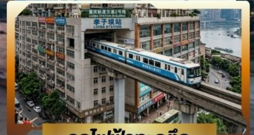
รถไฟฟ้ากะลุ่ก