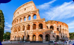
เที่ยวกรุงโรม