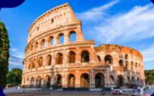
เที่ยวกรุงโรม