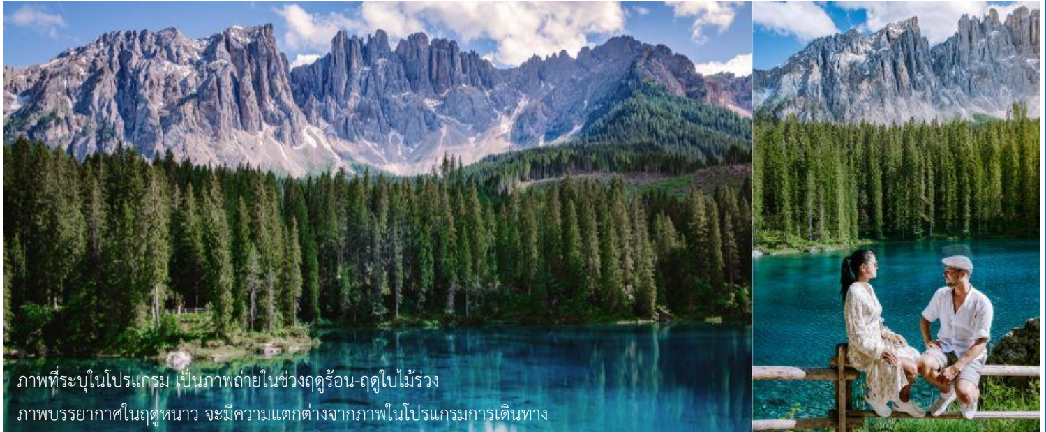
ภาพที่ระบุในโปรแกรม เป็นภาพถ่ายในช่วงฤดูร้อน-ฤดูใบไม้ร่วง ภาพบรรยากาศในฤดูหนาว จะมีความแตกต่างจากภาพโปรแกรมการเดินทาง

มองเห็นได้อย่างชัดเจนจากทุกมุมมอง ท่านจะได้ชมความงามของภูเขา Dolomites ซึ่งได้รับการขึ้นทะเบียนเป็นมรดกโลกจากยูเนสโก ถึงเวลาอันสามครรนำท่านเดินทางกลับลงมาที่ตัวเมืองออดิเซ่