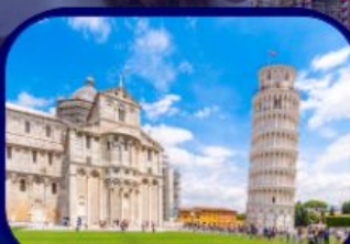
หอเอนแห่งเมืองปิซ่า