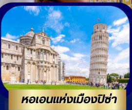
หอเอนแห่งเมืองปิซ่า

Special OFFER ฟรี !! ล่องเรือ Gondola เกาะเวนิส เมืองแห่งสายน้ำสุดโรแมนติก