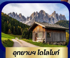
อุทยานฯ โดโลไมท์