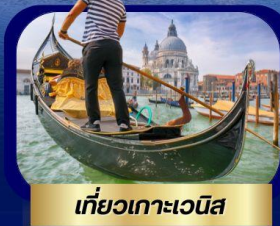
เที่ยวเกาะเวนิส