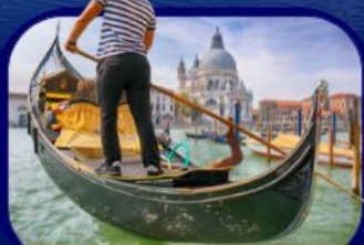
เที่ยวเกาะเวนิส