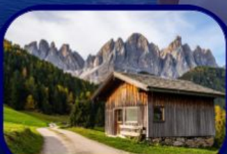
อุทยานฯ โดโลไมท์