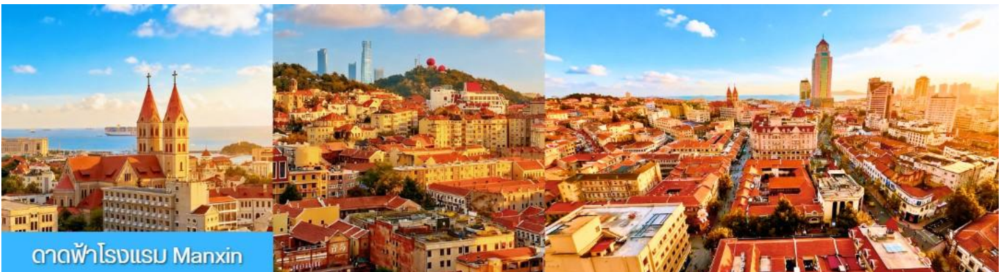
ตาดฟ้าโรงแรม Manxin

กลางวัน อิสระอาหารเพื่อให้ท่านมีความสุขในการเดินช้อปปิ้ง และท่านสามารถเลือกชิมอาหารพื้นเมืองตามอัธยาศัย จนได้เวลาอันสมควร ตามเวลานัดหมาย นำท่านเดินทางสู่ ถนนหลงเจียงลู่ ให้ท่านถ่ายรูป ถนนหลงเจียงลู่ ถนนสายการ์ตูน อะนิเมะ น่ารัก ๆ เหมาะกับการถ่ายรูป เซ็คอิน