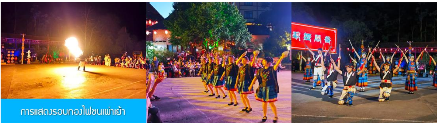
การแสดงรอบกองไฟชนเผ่าเย้า

หลังอาหารท่านสามารถชม การแสดงรอบกองไฟ 篝火表演 เป็นการแสดงพื้นเมืองของชนเผ่าเย้า (การแสดงรอบกองไฟจะงดจัดการแสดงในวันที่สภาพอากาศไม่เอื้ออำนวย) พักที่ NANDAN JINFUYAO HOTEL ระดับ 4 ดาวท้องถิ่นหรือเทียบเท่าในเมืองหนานตัน