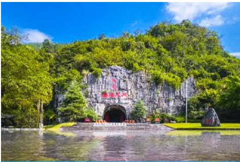
ถ้ำบ่มเหล้าขาวดั่งเทียนจิวไห่