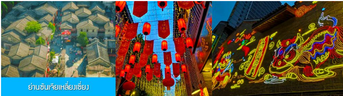
ย่านชุนเจียงเหลียงเซียง