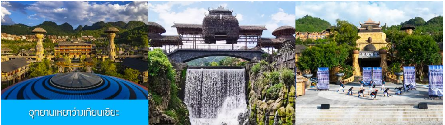
อุทยานเหวอว่างเทียนเซี่ยะ