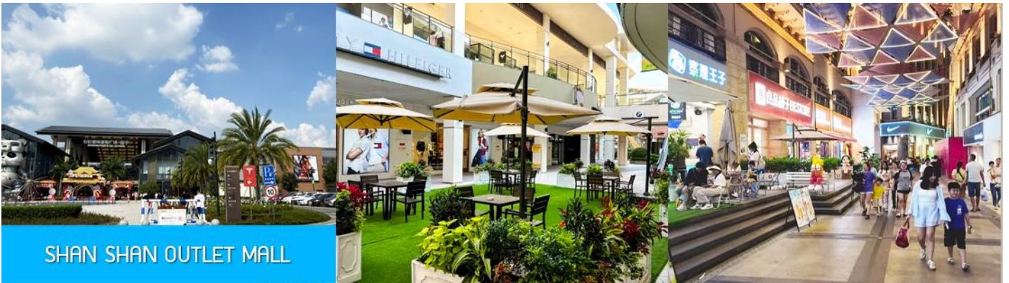
SHAN SHAN OUTLET MALL