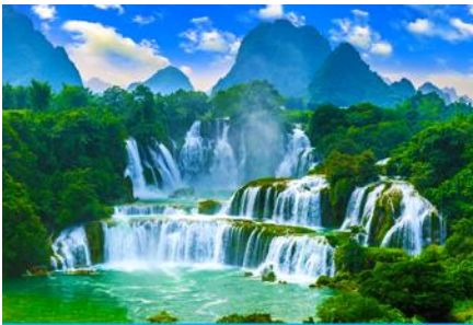
น้ำตกเต๋อเทียน