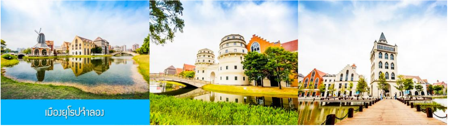
เมืองยุโรปจำลอง