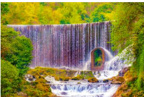
อุทยานธรรมชาติเสี่ยวชิ่ง