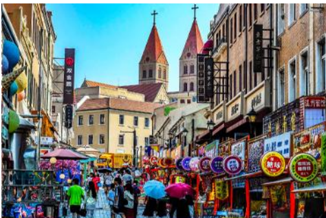
ถนนางซาน