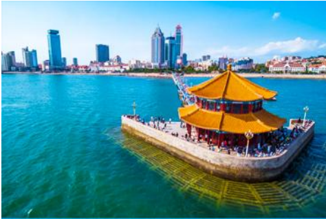
สะพานเคียงเอียว