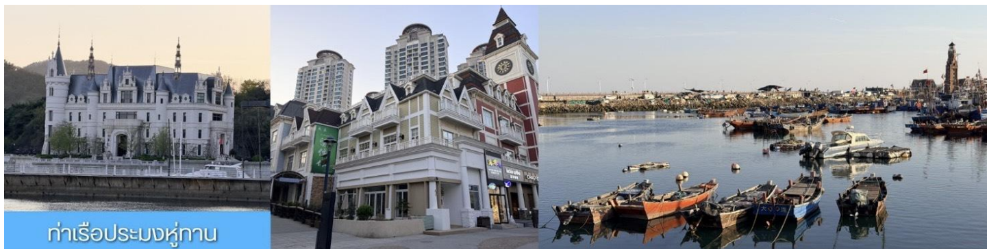
ท่าเรือประมงหมู่ทาน

หลังอาหารเช้า นำท่าน ทิวชม ท่าเรือประมงหมู่ทาน 大连渔人码头 เป็นจุดเช็คอินที่โดดเด่นด้วยสถาปัตยกรรมสไตล์ยุโรปสีสันสดใส ผสมผสานกลิ่นอายเมืองท่าดั้งเดิมเข้ากับบรรยากาศสุด โรแมนติกที่เต็มไปด้วยเรือประมง คาเฟ่ ร้านอาหาร และจุดชมวิวยุริยเมฆ