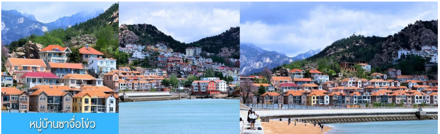
หมู่บ้านซาจื่อโจว

หลังอาหารนำท่านสัมผัสเสน่ห์เสน่ห์ของหมู่บ้านชาวประมง ซาจื่อโจว 沙子口渔村 ให้ท่านได้ชมวิถีชีวิตดั้งเดิมกับทิวทัศน์ชายทะเล วิถีบ้านเรือนหลากสีที่ตั้งเรียงรายตามแนวชายฝั่งที่โดดเด่นด้วยเอกลักษณ์ ทำให้ หมู่บ้านซาจื่อโจว เป็นเอกลักษณ์เป็นจุดถ่ายภาพราวกับเมืองชายฝั่งของอิตาลีในยุโรป, จึงเป็นที่ดึงดูดให้นักท่องเที่ยวต่างอยากมาสัมผัสบรรยากาศ ณ หมู่บ้านชาวประมงซาจื่อโจวแห่งนี้ จากนั้นนำท่านเดินทางสู่ เมือง เวย์ไห่ 威海 (ระยะทาง 250 กม.ใช้เวลาเดินทางราว 3 ชั่วโมง) ตั้งอยู่ปลายเหนือสุดของคาบสมุทรซานตง ซึ่งเป็นเมืองท่าสำคัญที่มีชายฝั่งทะเลสวยงามสะอาด อากาศเย็นสบายในฤดูร้อนและมี