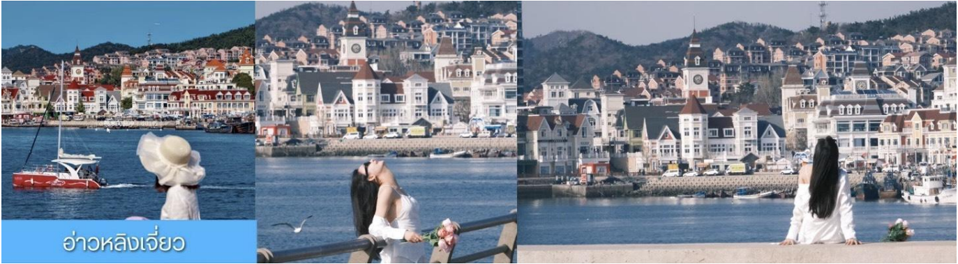
อ่าวหลังเจี๋ยอ