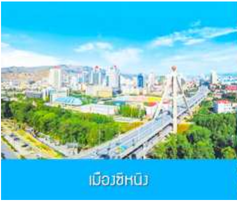
เมืองซีหนิง