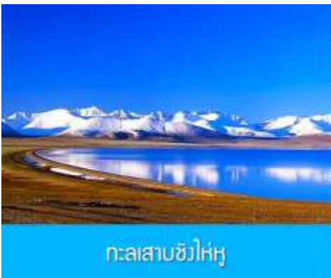
ทะเลสาบชิงไห่หู