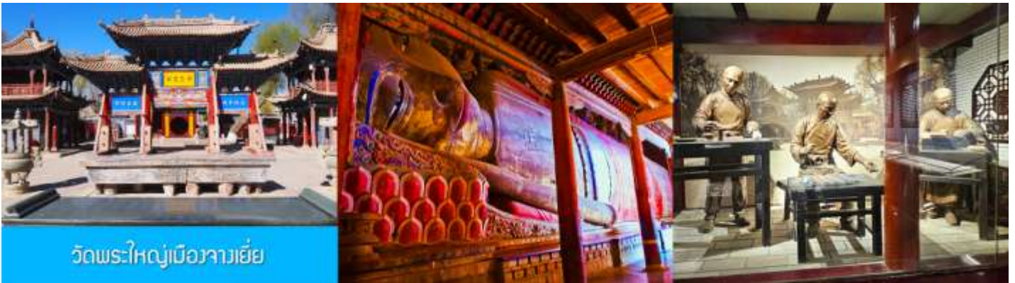
วัดพระใหญ่เมืองจางเยี่ย

รับประทานอาหารเช้า ณ ห้องอาหารของโรงแรม (15)