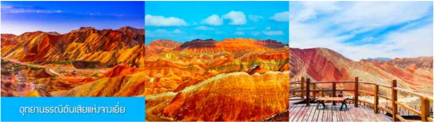
อุทยานธรณีดินสีแห่งจางเยี่ย