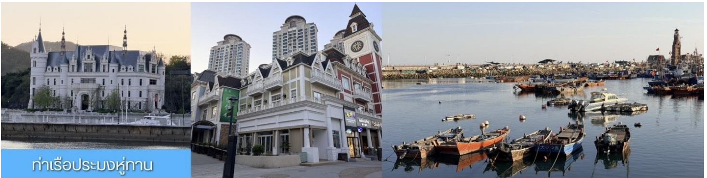
ท่าเรือประมงหู่กาน

พักที่ DALIAN JUZISHUIJING HOTEL หรือ โรงแรมระดับ 4 ดาวท้องถิ่น เมืองต้าเหลียน