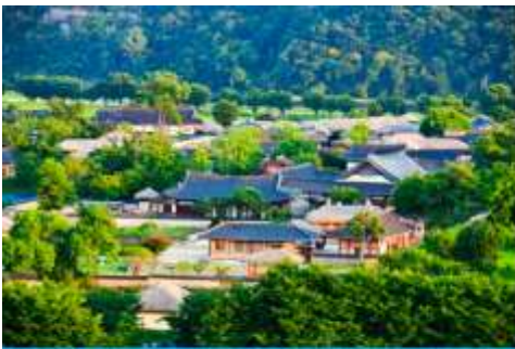
ศูนย์วัฒนธรรมเกาหลี

เช้า รับประทานอาหารเช้า ณ ห้องอาหารของโรงแรม (6)