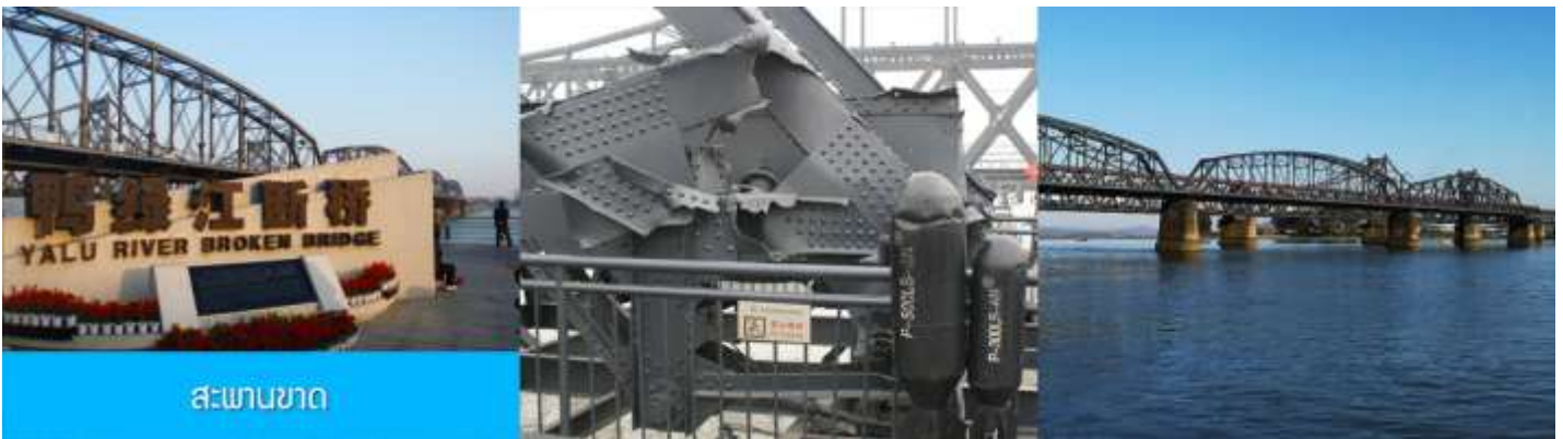
สะพานขาด