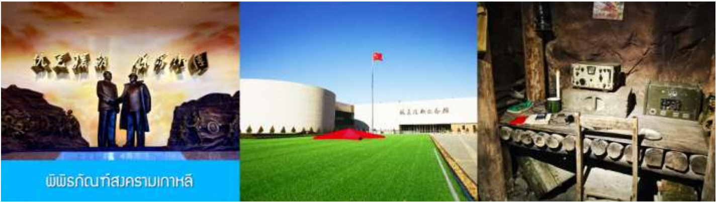
พิพิธภัณฑ์สงครามเกาหลี