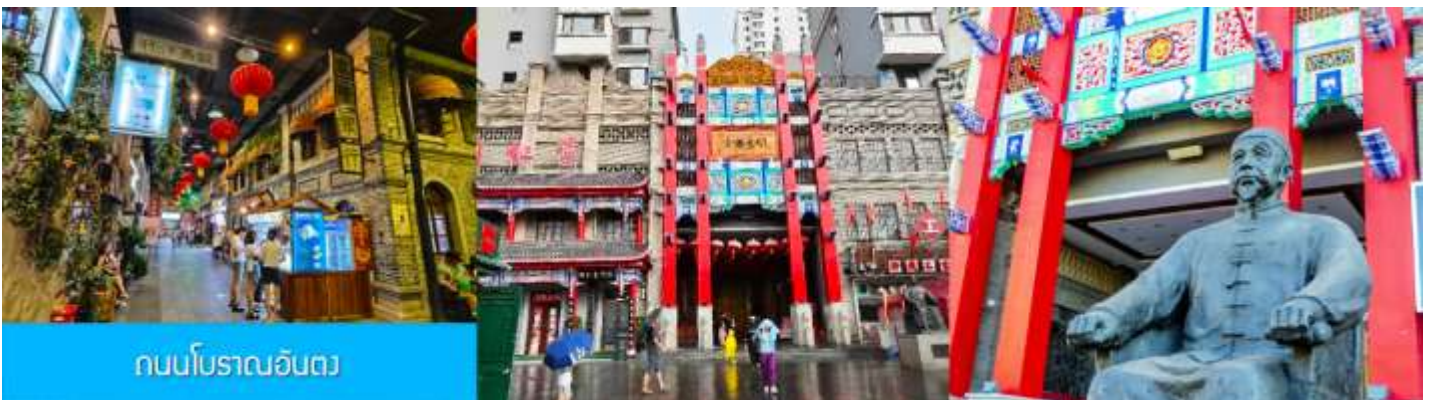
ถนนโบราณอันตง