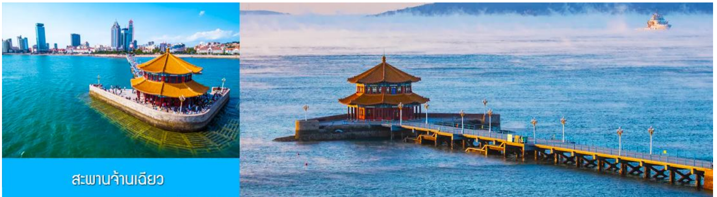
สะพานจ้านเจียว