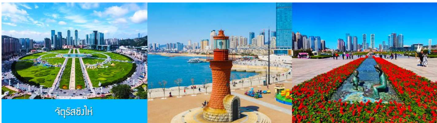
จัตุรัสซิงไห่

เช้า รับประทานอาหารเช้า ณ ห้องอาหารของโรงแรม (1)