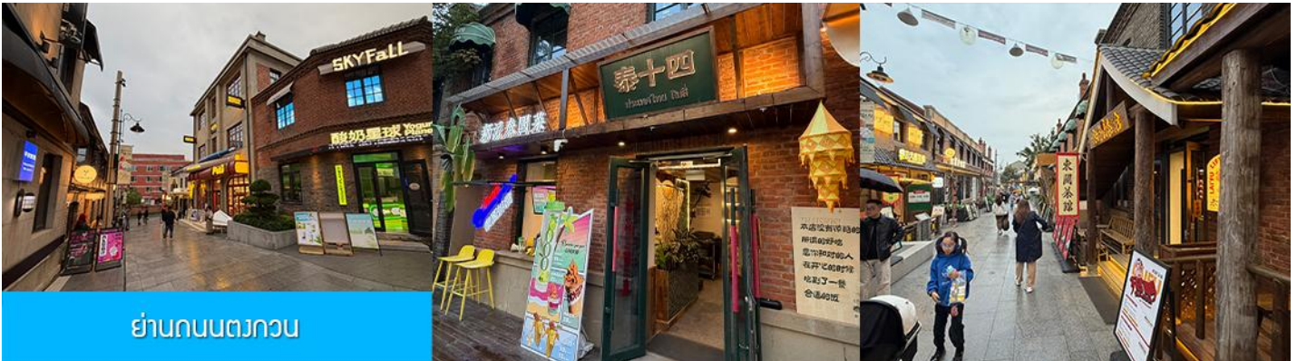
ย่านถนนตวงกวน

หลังอาหารนำท่านเที่ยวชม จัตุรัสชิงไห่ 星海广场 เป็นจัตุรัสขนาดใหญ่เป็นแลนด์มาร์คสำคัญของเมืองต้าเหลียน สร้างขึ้นเพื่อเฉลิมฉลองในโอกาสที่รัฐบาลอังกฤษคืนเกาะฮ่องกงให้จีนในปี ค.ศ. 1997 ตั้งอยู่ชายฝั่งทะเลในเมืองต้าเหลียน เป็นจัตุรัสใจกลางเมืองที่ใหญ่ที่สุดในโลกและ เป็นแลนด์มาร์คของเมืองต้าเหลียน รายล้อมด้วยตึกระฟ้าที่ทันสมัย ภายในมีบ่อน้ำพุดนตรี ลานหญ้าขนาดใหญ่ และลานกว้างสำหรับจัดกิจกรรมกลางแจ้ง อาทิ เทศกาลเบียร์นานาชาติ การแข่งขันวิ่งมาราธอน งานแฟชั่นนานาชาติเมืองต้าเหลียน ฯลฯ