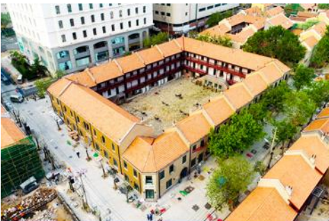
เมืองเก่าเยอรมัน ตรอกกว่างซิงหลี่