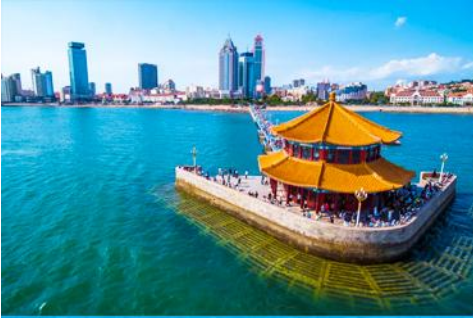
สะพานจ้านเจียว