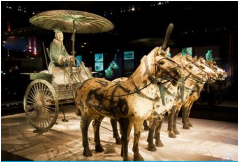
สุสานกองทัพทหารม้าจีน