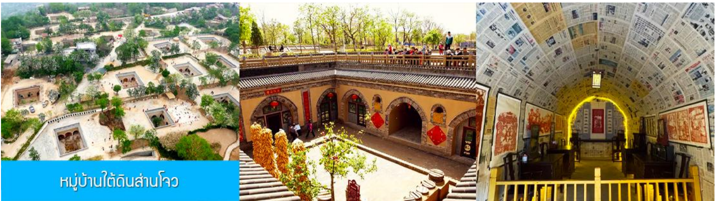
หมู่บ้านใต้ดินสามโจว

หลังอาหารนำท่านเดินทางสู่ เมืองซานเหมินเกีย 三门峡 (ระยะทาง 149 กม ใช้เวลาเดินทางราว 2 ชั่วโมง)