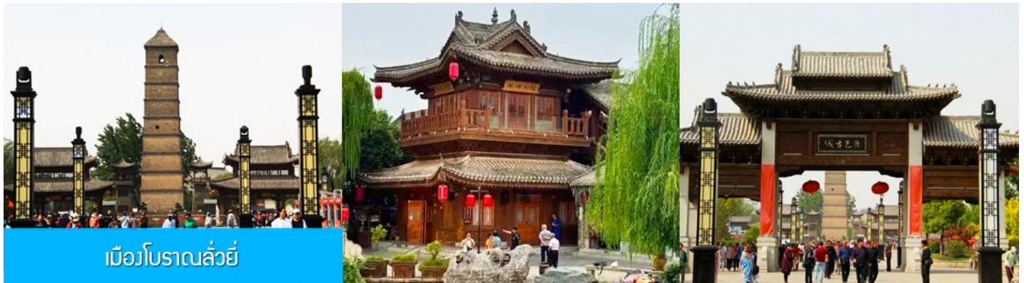
เมืองโบราณลั่วยี่

16.18 น. ขบวนรถไฟนำคณะเดินทางถึงสถานีรถไฟนครลั่วหยาง นำคณะขึ้นรถบัสเพื่อเดินทางสู่นครลั่วหยาง