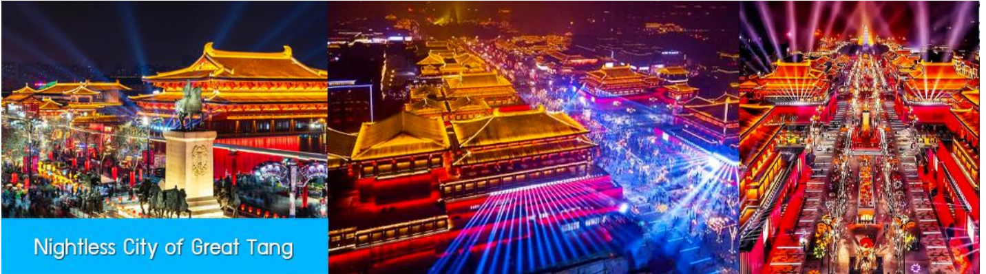
Nightless City of Great Tang

หลังอาหารนำท่านเที่ยวชม Nightless City of Great Tang สถานที่ท่องเที่ยวกลางแจ้งที่สร้างจำลองบรรยากาศย้อนยุคสมัยราชวงศ์ถังที่สอดคล้องการ ท้ามกลางแสง สี และโคมไฟที่ประดับอย่างสวยงามตระการตาเป็นที่เชิดอิน ถ่ายภาพยอดเยี่ยมแห่งใหม่ของนครซีอาน