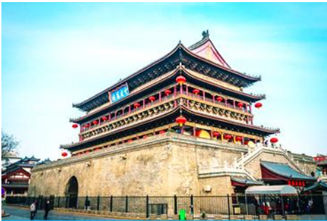
จัตุรัสหอกลอง