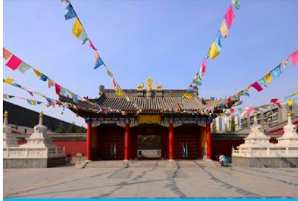
วัดลามะกว่างเหริน