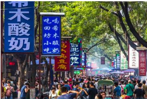
ตลาดมุสลิม