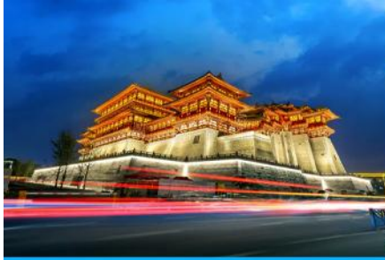
นครลั่วหยาง