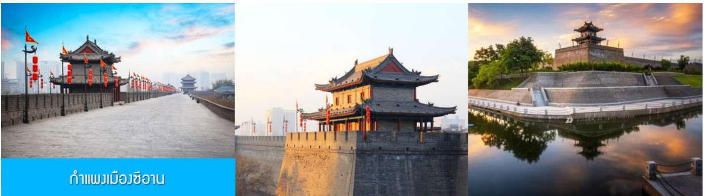
กำแพงเมืองซีอาน

หลังอาหารนำท่านนั่งรถบัสดูผ่านชม กำแพงเมืองโบราณ 西安古城墙 (เป็นการนั่งรถผ่านชมด้านนอก เนื่องจากค่าทัวร์ไม่ได้รวมค่าบัตรเข้าชมด้านใน ) กำแพงเมืองเก่าแก่ที่สร้างขึ้นในสมัยราชวงศ์หมิง อายุกว่า 600 ปี ตัวกำแพงมีฐานกว้าง 18 เมตร มีความสูง 12 เมตร ความยาวโดยรอบ 11.9 กิโลเมตร เป็นกำแพงเก่าแก่ที่ยังคงสภาพสมบูรณ์ที่สุดของจีน และเป็นโบราณสถานขึ้นชื่อของเมืองซีอาน