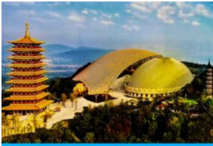
อุทยานหนิวสั่วซาน