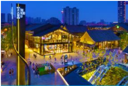
ถนนไท่กู่หลี่ และวัดต้าเจี๋ย