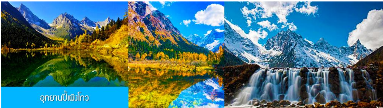
อุทยานปีเพิงโกว