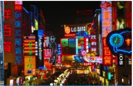
ถนนคนเดินซุนซีลู่