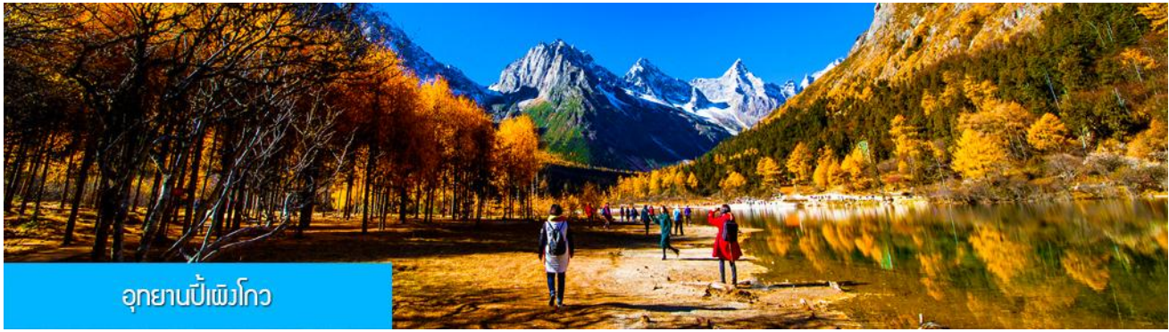
อุทยานปีเพิงโกว