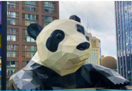
หมีแพนด้าปีนตึก ณ ตึก IFS