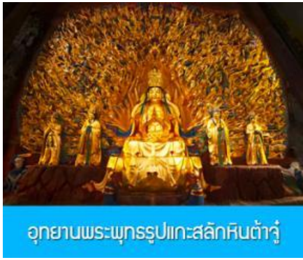
อุทยานพระพุทธรูปแกะสลักหินต้าจู่