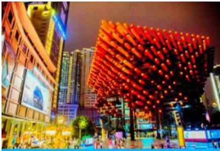
หอศิลป์กั๋วไท่