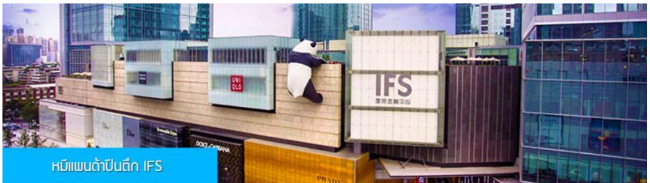
หมีแพนด้าปีนตึก IFS