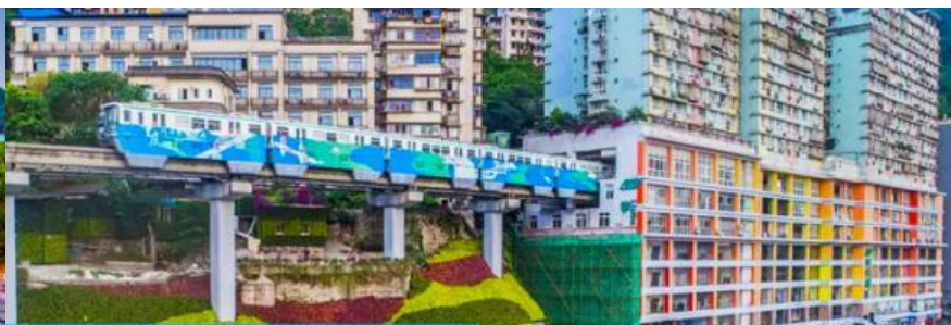
รถไฟฟ้าตุ้ก

วันที่สี่ นครจิงซี-มหาศาลาประชากบ-รถไฟฟ้าตุ้ก-ตึกตะเกียบ-อิสระซ้อปิ้งย่านเจียงฟางเปย –เมืองตูเจียงเยียน – สะพานหนานเจียว