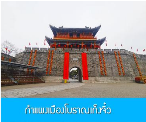
กำแพงเมืองโบราณเก็งจิ๋ว

เที่ยง รับประทานอาหารกลางวัน ณ ภัตตาคาร (11)