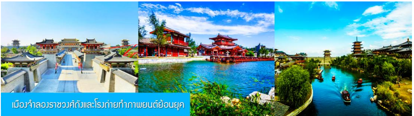
เมืองจำลองราชวงศ์ถังและโรงถ่ายทำภาพยนตร์ย้อนยุค