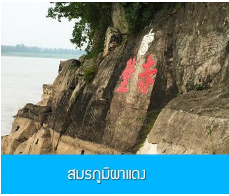
สมรภูมิผาแดง