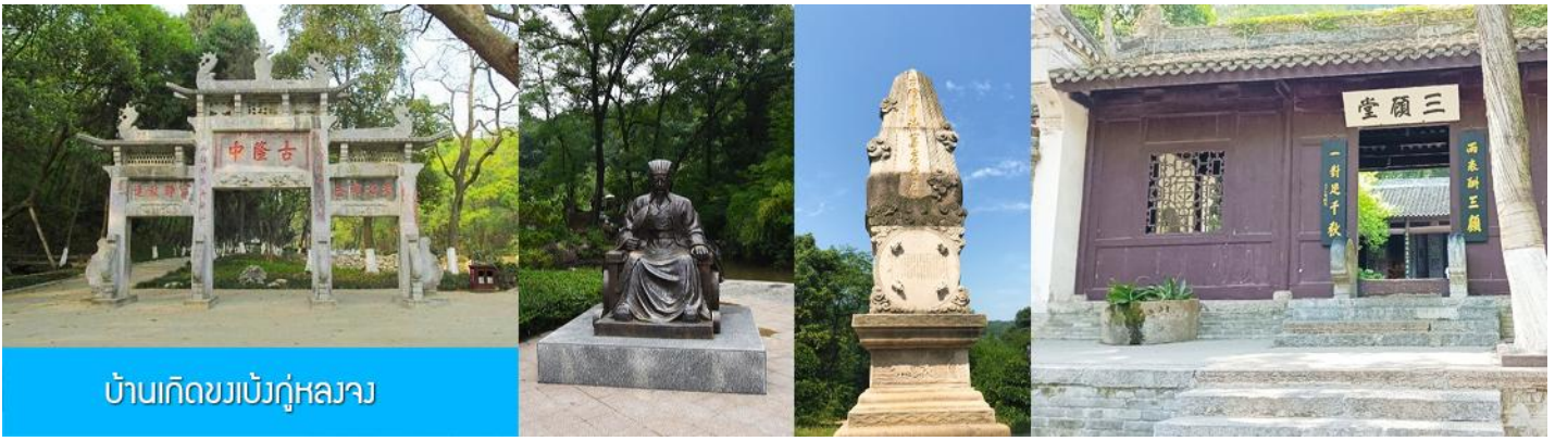
บ้านเกิดขงเบ้งกู่หลางจว