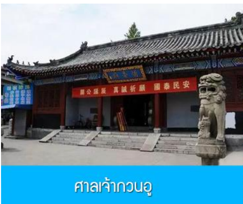
ศาลเจ้ากวนอู