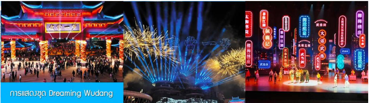
การแสดงชุด Dreaming Wudang