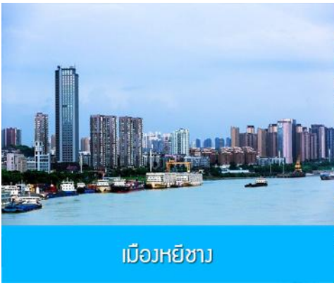
เมืองหยีซาง