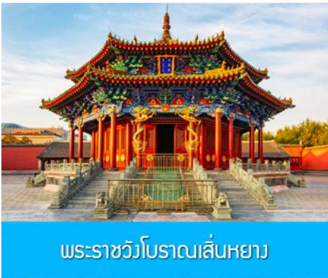
พระราชวังโบราณเสิ่นหยาง

จากนั้นนำท่านเดินทางสู่ เมืองเสิ่นหยาง 沈阳 (ระยะทาง 280 กม. ใช้เวลาเดินทางราว 3 ชั่วโมงเศษ) เที่ยง รับประทานอาหารกลางวัน ณ ภัตตาคาร (8)