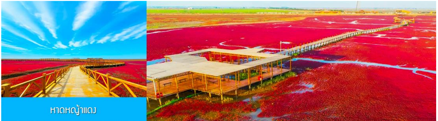
หาดหญ้าแดง

หลังอาหารเช้าเดินทางสู่ เมืองผานจิน 盘锦 (ระยะทาง 170 กม. ใช้เวลาเดินทางราว 2 ชั่วโมงเศษ)