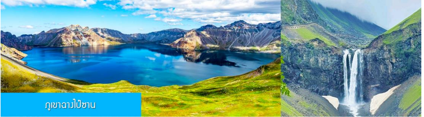
ภูเขาฉางไป๋ซาน

หลังอาหารนำท่านเที่ยวชม ยอดเขาฉางไป๋ซาน 长白山 (จีน/ลงเนินด้านทิศเหนือ) ชมความงามที่เร้นลับของ ทะเลสาบเทียนฉือ 天池 ที่เชื่อกันว่าเป็นแหล่งน้ำศักดิ์สิทธิ์ที่อยู่ใกล้สวรรค์จนเป็นที่มาของคำว่าเทียนฉือที่ แปลว่าทะเลสาบบนสวรรค์ ชม น้ำตกเขาฉางไป๋ซาน 长白山瀑布 เป็นน้ำตกที่ไหลลงมาจากหน้าผาขนาดใหญ่ที่มีความสูง 68 เมตร น้ำตกแห่งนี้เป็นจุดน้ำไหลออกของทะเลสาบเทียนฉือ และเป็นต้นกำเนิดของแม่น้ำซงฮัวเจียง....ชม สระน้ำมรกต 绿渊潭 สระน้ำสีเขียวมรกตที่มีน้ำตกน้อยสองสายที่คอยเติมน้ำเข้าไปในสระ เป็น