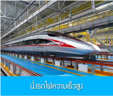
บริการรถไฟความเร็วสูง