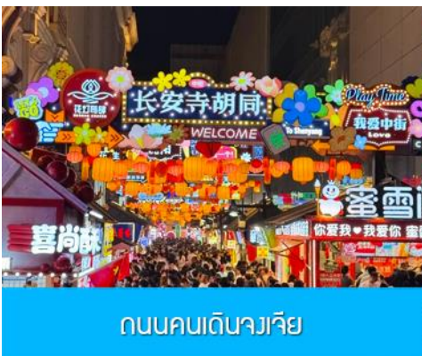
ถนนคนเดินจวงเจีย