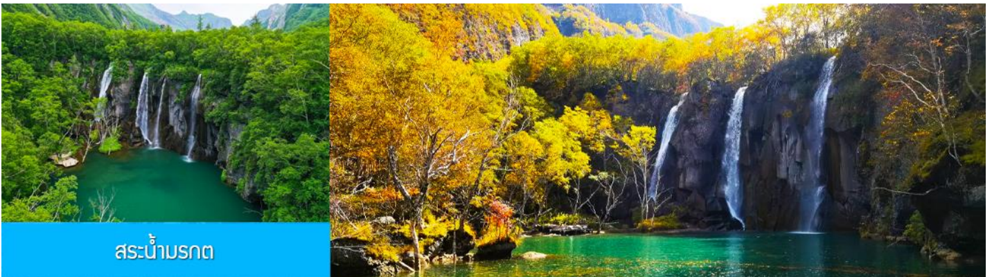
สระน้ำมรกต

หลังอาหารนำท่านเที่ยวชม ยอดเขาฉางไป๋ซาน 长白山 (จีน/ลงเนินด้านทิศเหนือ) ชมความงามที่เร้นลับของ ทะเลสาบเทียนฉือ 天池 ที่เชื่อกันว่าเป็นแหล่งน้ำศักดิ์สิทธิ์ที่อยู่ใกล้สวรรค์จนเป็นที่มาของคำว่าเทียนฉือที่ แปลว่าทะเลสาบบนสวรรค์ ชม น้ำตกเขาฉางไป๋ซาน 长白山瀑布 เป็นน้ำตกที่ไหลลงมาจากหน้าผาขนาดใหญ่ที่มีความสูง 68 เมตร น้ำตกแห่งนี้เป็นจุดน้ำไหลออกของทะเลสาบเทียนฉือ และเป็นต้นกำเนิดของแม่น้ำซงฮัวเจียง....ชม สระน้ำมรกต 绿渊潭 สระน้ำสีเขียวมรกตที่มีน้ำตกน้อยสองสายที่คอยเติมน้ำเข้าไปในสระ เป็น