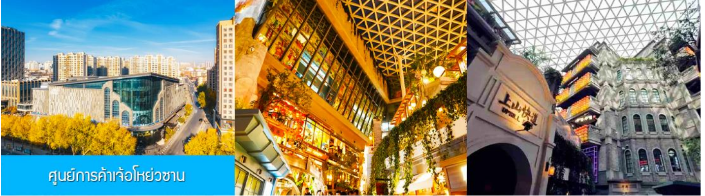
ศูนย์การค้าเจ้อหย่วซาน

นำท่านเที่ยวชม ศูนย์การค้าเจ้อหย่วซาน 这有山 แหล่งช้อปปิ้งจีนชื่อดังที่ผสมผสานระหว่างสถานที่ท่องเที่ยวและแหล่งรวมร้านค้า และร้านแนวฟาสต์ฟู้ด อาหารพื้นเมืองร่วมสมัย ภายใต้คอนเซ็ปต์ แหล่งช้อปปิ้งบนภูเขา และบนภูเขามียแหล่งช้อปปิ้ง เป็นจุดเช็คอินยอดนิยมที่เปิดให้คนพื้นที่และนักท่องเที่ยวเข้าชมตั้งแต่ปี ค.ศ. 2019