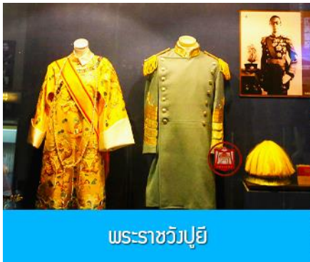
พระราชวังปูยี

รับประทานอาหารเช้า ณ ห้องอาหารของโรงแรม (7)