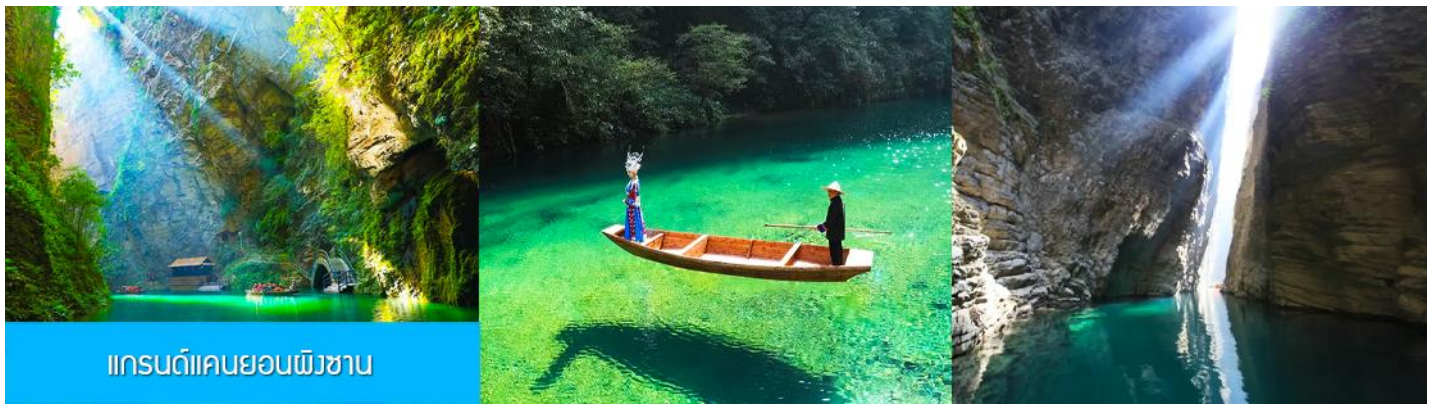
แกรนด์แคนยอนผิงซาน