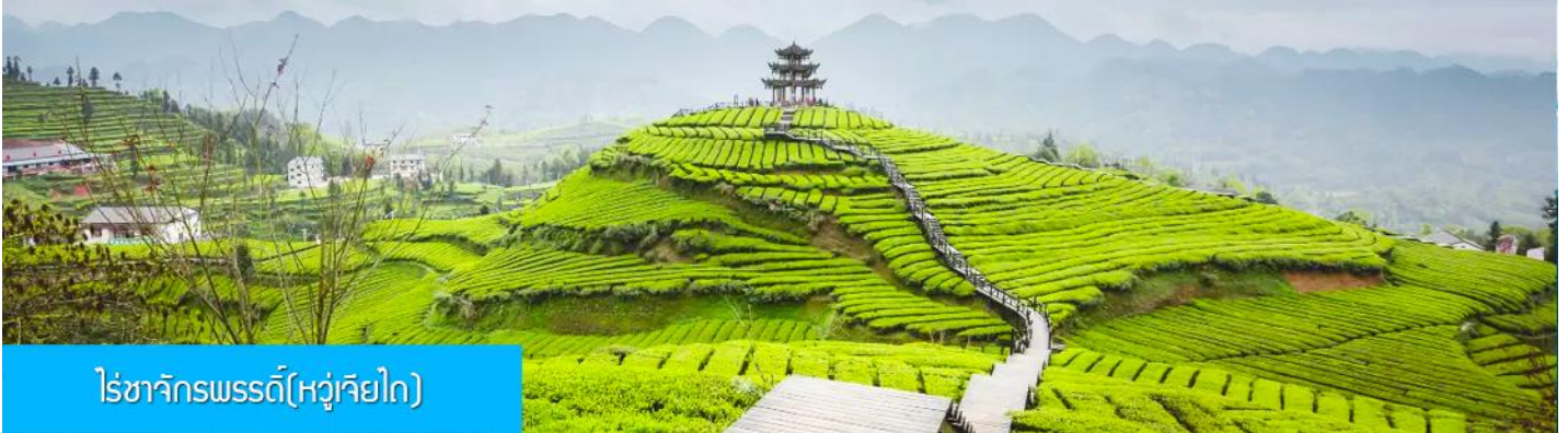
ไร่ชาจักรพรรดิ(หู่เจียโต)

เช้า รับประทานอาหารเช้า ณ ห้องอาหารของโรงแรม (4)