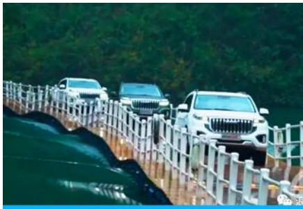
นั่งรถผ่านชมถนนลอยน้ำด่านสิงโต