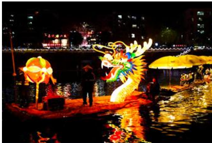
นั่งเรือมังกรเที่ยวชมความงาม