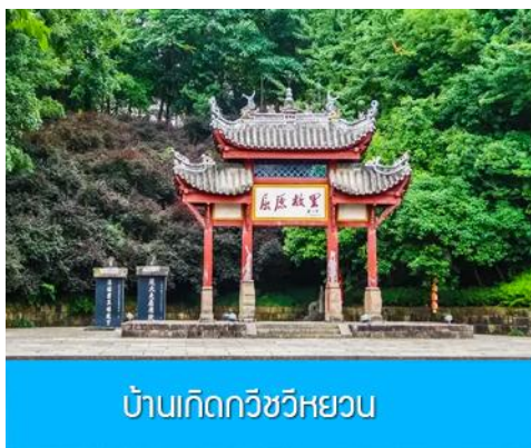
บ้านเกิดกวีชวีหยวน

พักที่ XIAZHOU HOTEL OR HONGQIAO HOTEL ระดับ 4 ดาวท้องถิ่นหรือเทียบเท่าในเมืองหยีซาง