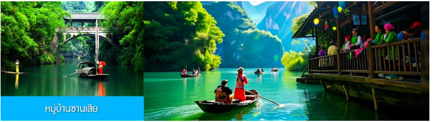
หมู่บ้านชาเบิย