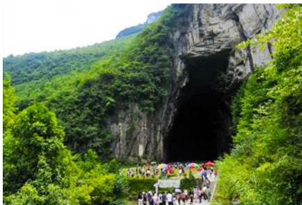
ถ้ำพญามังกร