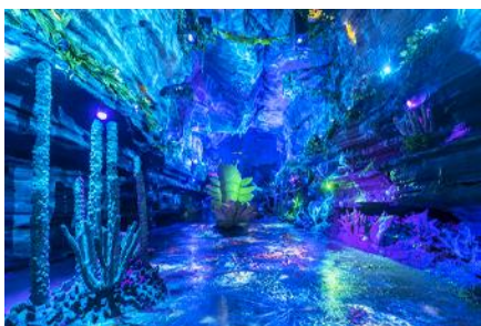
ป่าหิน ส่วปู้ย่า

รับประทานอาหารเช้า ณ ห้องอาหารของโรงแรม (10)