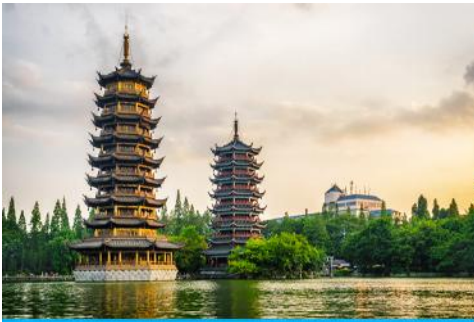
เจดีย์มื่น เจดีย์ก๊วง