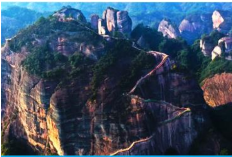
อุทยานปาเจียว้าย