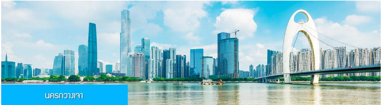
นครกวางเจา

คณะเดินทางพร้อมกันที่ ท่าอากาศยานสุวรรณภูมิ อาคารผู้โดยสารขาออกระหว่างประเทศ ชั้น 4 ประตู 10 เคาน์เตอร์เช็คอิน สายการบิน 9AIR (AQ) โดยมีเจ้าหน้าที่บริษัทฯ คอยให้การต้อนรับและอำนวยความสะดวกในการเช็คอิน