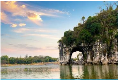
เขาวงจ้ำว