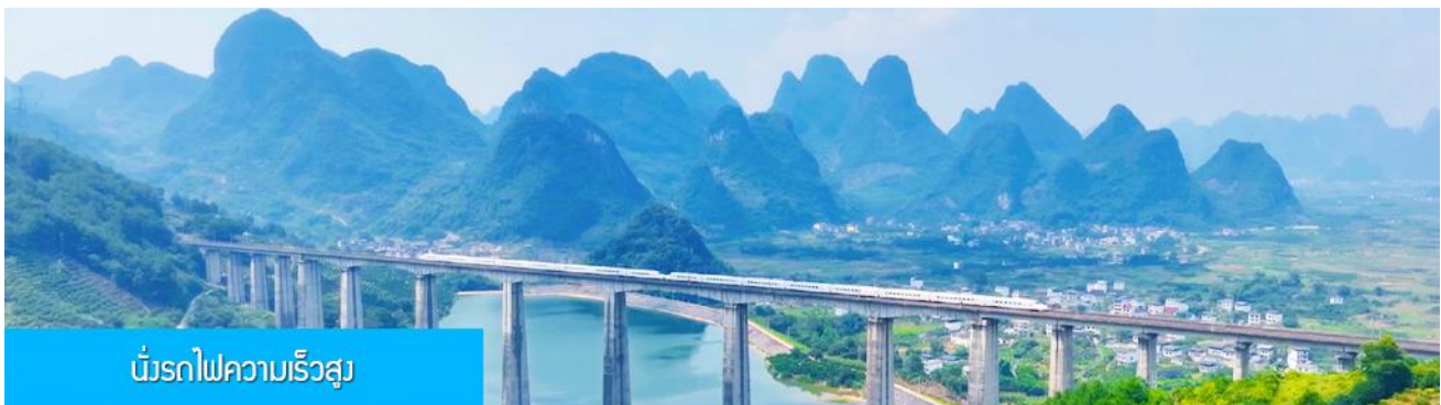
นั้รถไฟความเร็วสูง

หลังอาหารนำท่านเดินทางสู่สถานีรถไฟความเร็วสูง นครกวางเจา