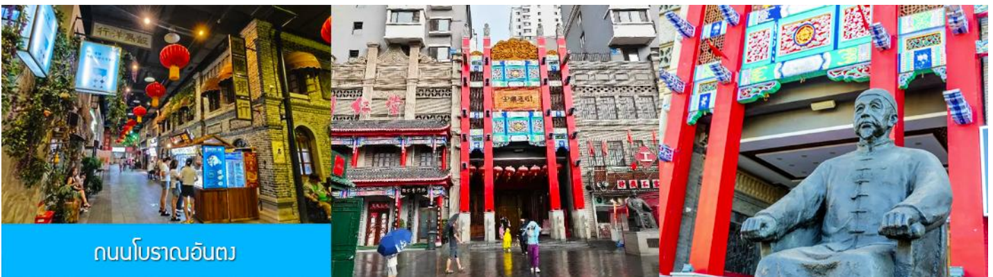
ถนนโบราณอันตง