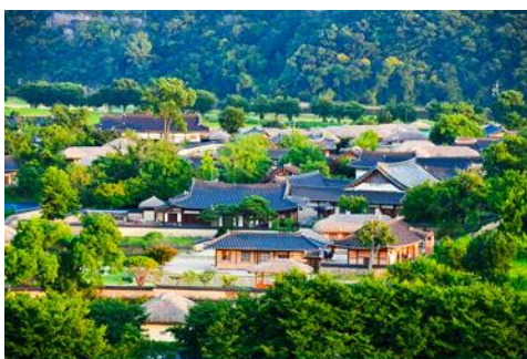
ศูนย์วัฒนธรรมเกาหลี

เช้า รับประทานอาหารเช้า ณ ห้องอาหารของโรงแรม (6)