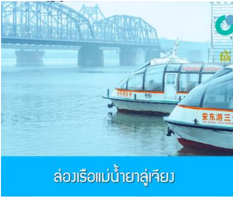
ล่องเรือแม่น้ำยาลู่เจียง

หลังอาหารให้ท่านพักผ่อนตามอัชฌาศัยในโรงแรม