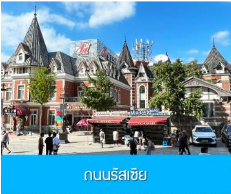
ถนนรัสเซีย