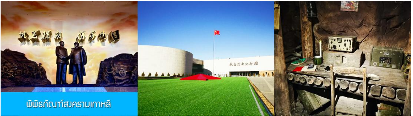
พิพิธภัณฑ์สงครามเกาหลี