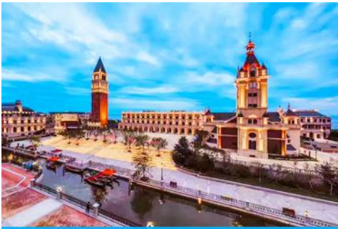
เมืองเวนิสตะวันออก