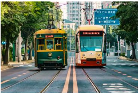
รถรางไฟฟ้า