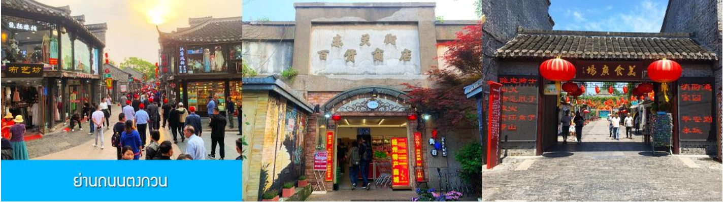
ย่านถนนตงกวน

ชม จัตุรัสชิงไห่ 星海广场 เป็นจัตุรัสขนาดใหญ่เป็นแลนด์มาร์คสำคัญของเมืองต้าเหลียน สร้างขึ้นเพื่อเฉลิมฉลองในโอกาสที่รัฐบาลอังกฤษคืนเกาะฮ่องกงในให้จีนในปี ค.ศ. 1997 ตั้งอยู่ชายฝั่งทะเลในเมืองต้าเหลียน เป็นจัตุรัสใจกลางเมืองที่ใหญ่ที่สุดในโลกและ เป็นแลนด์มาร์คของเมืองต้าเหลียน รายล้อมด้วยตึกระฟ้าที่ทันสมัย ภายในมีบ่อน้ำพุดนตรี ลานหญ้าขนาดใหญ่ และลานกว้างสำหรับจัดกิจกรรมกลางแจ้ง อาทิ เทศกาลเบียร์นานาชาติ การแข่งขันวิ่งมาราธอน งานแฟชั่นนานาชาติเมืองต้าเหลียน ฯลฯ