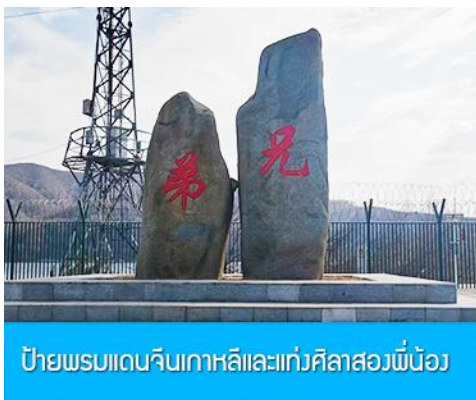
ป้ายพรมแดนจีนเกาหลีและแท่งศิลาสองพี่น้อง