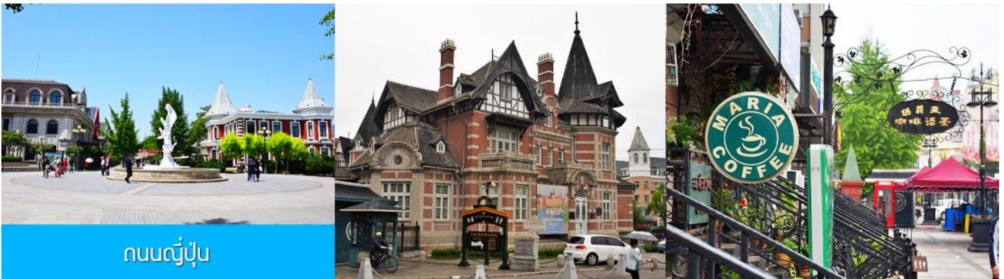
ถนนญี่ปุ่น