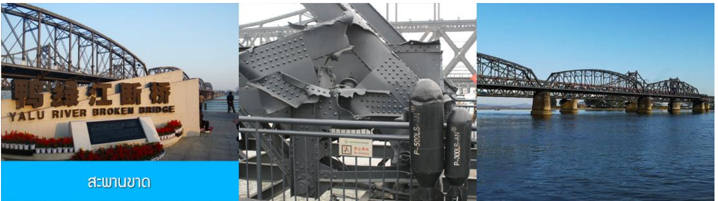
สะพานขาด