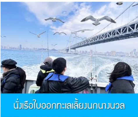
นั่งเรือใบออกทะเลลิ้นกนางนวล

ต่อด้วยนำท่านเที่ยวชมถนนรัสเซีย 俄罗斯风情街 ในอดีตที่นี่เป็นศูนย์ที่ตั้งของที่ทำการเมืองต้าเหลียน ภายหลังได้กลายเป็นชุมชนของพ่อค้าและวิศวกรทางรถไฟชาวรัสเซีย บริเวณนี้จึงเต็มไปด้วยอาคารบ้านเรือนแบบตะวันตก(รัสเซีย) มากมาย นอกจากนี้ได้เก็บภาพที่มีพื้นหลังเป็นอาคารสถาปัตยกรรมตะวันตก ที่นี่ยังมีร้านค้าที่จำหน่ายสินค้าและของที่ระลึกที่นำเข้ามาจากรัสเซีย อาทิ ช็อคโกแลต เหล้าวอดก้า ตุ๊กตารัสเซีย ฯลฯ