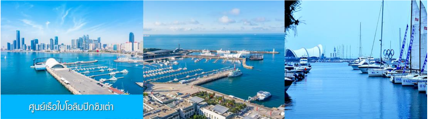
ศูนย์เรือใบโอลิมปิกชิงเต่า

จากนั้นนำท่านเที่ยวชม โรงเบียร์ชิงเต่า 青岛啤酒博物馆 พิพิธภัณฑ์เบียร์ที่ขึ้นชื่อของเมืองชิงเต่า ซึ่งเป็นเบียร์ยี่ห้อแรกที่ผลิตขึ้นในประเทศจีน ชมเบียร์ คอลเลกชันที่มียี่ห้อหลากหลายที่สุดของโลก และชมการจัดแสดงภาพและวิดิทัศน์เกี่ยวกับวิวัฒนาการของเบียร์ ขั้นตอนการผลิตและอื่น ๆ ที่เกี่ยวข้อง พร้อมชิมเบียร์ชิงเต่า ซึ่งเป็นเบียร์ที่ขายดีที่สุดในยี่ห้อหนึ่งของจีน.. (ชิมเบียร์ชิงเต่าท่านละ 1 แก้ว รับกลับอีก 1 ขวดเล็ก ตอนเดินออก)