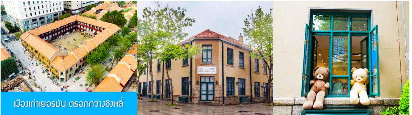
เมืองเก่าเยอรมัน ตรอกกว้างชิงหลี่

จากนั้นนำท่านเดินเที่ยวชม ถนนจงซาน 中山路 ถนนที่เต็มไปด้วยกลิ่นอายยุโรป และถนนสายนี้มีบันทึกเรื่องราวมากกว่าศตวรรษของเมืองชิงเต่าไว้ ที่นี่เป็นศูนย์กลางการค้าแห่งแรกที่เต็มไปด้วยสถาปัตยกรรมสไตล์ยุโรปเก่าแก่ที่ได้รับอิทธิพลมาจากเยอรมัน ให้ท่านได้เดินเก็บบรรยากาศ และ เก็บภาพกับโบสถ์เซนต์ไมเกล (ด้านนอก) โบสถ์แห่งนี้ที่คู่รักนิยมมาถ่ายภาพงานแต่งงานมากที่สุดในเมืองชิงเต่า ให้ท่านถ่ายรูปเก็บภาพ