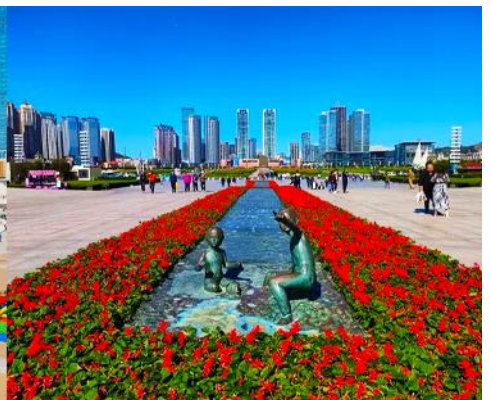
จัตุรัสชิงไห่