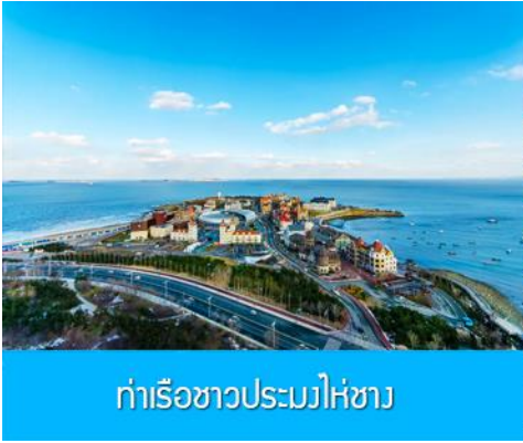
ท่าเรือชาวประมงไห่ซาง