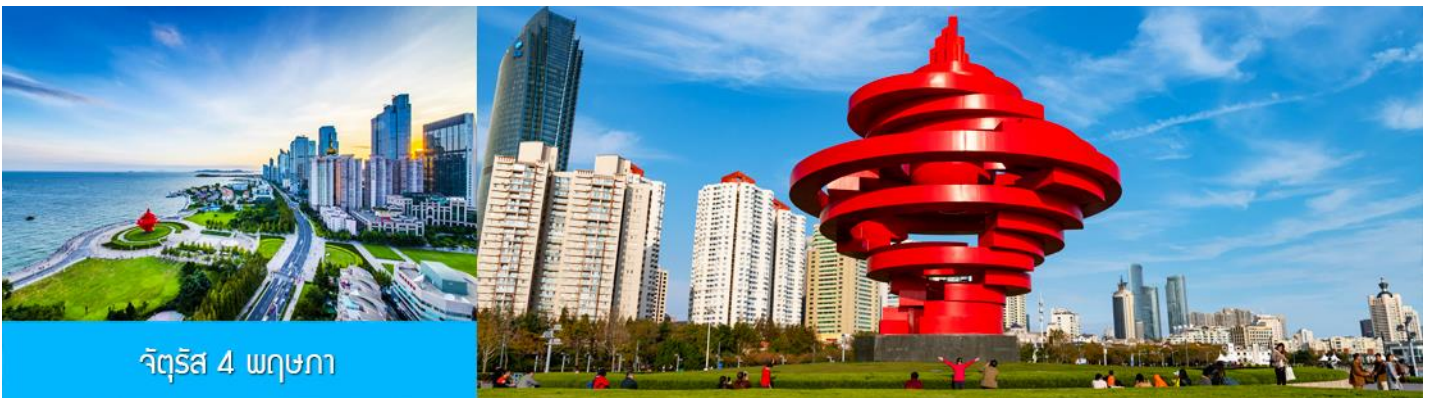
จัตุรัส 4 พฤษภาคม

จากนั้นนำท่านเที่ยวชม ศูนย์เรือใบโอลิมปิกชิงเต่า (Qingdao Olympic Sailing Center) ซึ่งเป็นสถานที่จัดการแข่งขันเรือใบในโอลิมปิกฤดูร้อน 2008 ปัจจุบันเป็นสถานที่ท่องเที่ยวชั้นนำริมทะเลที่สวยงาม มีท่าจอดเรือยอชท์, พื้นที่จัดกิจกรรม, และทิวทัศน์ที่สวยงาม ให้ท่านเก็บภาพบรรยากาศความสวยงามตามอัธยาศัย