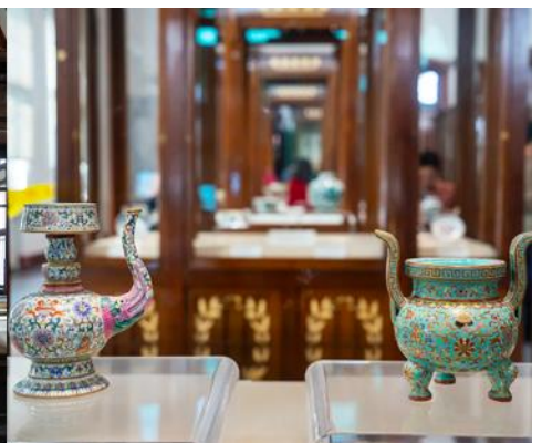
พิพิธภัณฑสถานประวัติศาสตร์หลี่ซุ่น

จากนั้นนำท่านเที่ยวชมและเก็บภาพ ณ พิพิธภัณฑสถานประวัติศาสตร์หลี่ซุ่น 旅顺博物馆 เป็นอาคารพิพิธภัณฑ เก่าแก่อายุกว่าร้อยปีแห่งแรกที่สร้างขึ้นทางภาคตะวันออกเฉียงเหนือของจีน อาคารพิพิธภัณฑที่มีความโดดเด่น ด้วยสถาปัตยกรรมแบบกรีกโรมันยุคเรเนสซองส์ ผสมผสานสถาปัตยกรรมแบบตะวันตก ภายในมีการจัดแสดง โบราณวัตถุกว่า 60,000 ชิ้น ท่านสามารถเก็บภาพที่ระลึกด้านหน้าอาคารพิพิธภัณฑ และสามารถเข้าชม โบราณวัตถุภายในพิพิธภัณฑได้ตามอรรถาสัย (พิพิธภัณฑที่ปิดทุกวันจันทร์)..