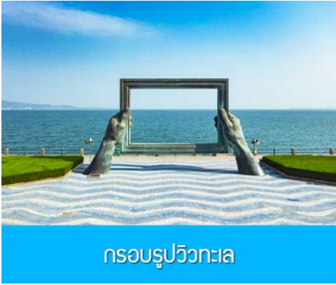
กรอบรูปวิวกทะเล