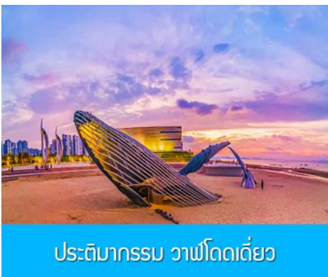
ประติมากรรม วาฬโดดเดี่ยว

จากนั้นนำท่านเดินทางสู่เมืองเยียนไต 烟台 (ระยะทาง 72 กม. ใช้เวลาเดินทางราว 1 ชั่วโมง)