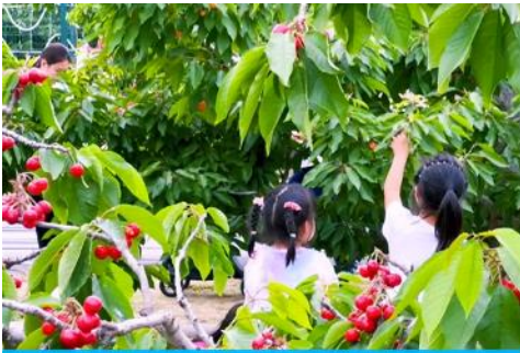
สวนเชอร์รี่