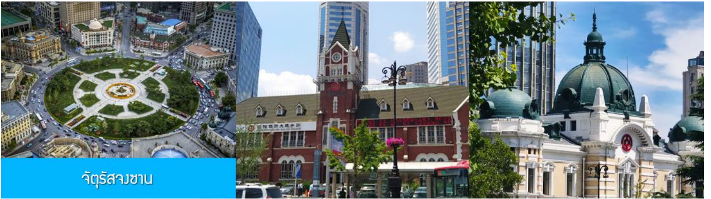
จัตุรัสวงเวียน