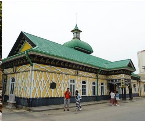
สถานีรถไฟหลี่ซุ่น

นำท่านเที่ยวชมและเก็บภาพ ณ สถานีรถไฟหลี่ซุ่น 旅顺火车站 เป็นสถานีปลายทางของเส้นทางรถไฟสาขา เส้นหยาง - ต้าเหลียน สร้างขึ้นในปีค.ศ. 1903 ออกแบบโดยสถาปนิกชาวรัสเซีย เป็นอาคารอิฐก่อปูนผสม โครงสร้างไม้ตามสถาปัตยกรรมรัสเซีย.