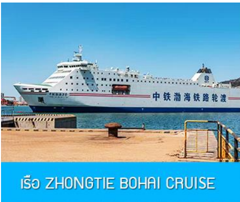
เรือ ZHONGTIE BOHAI CRUISE