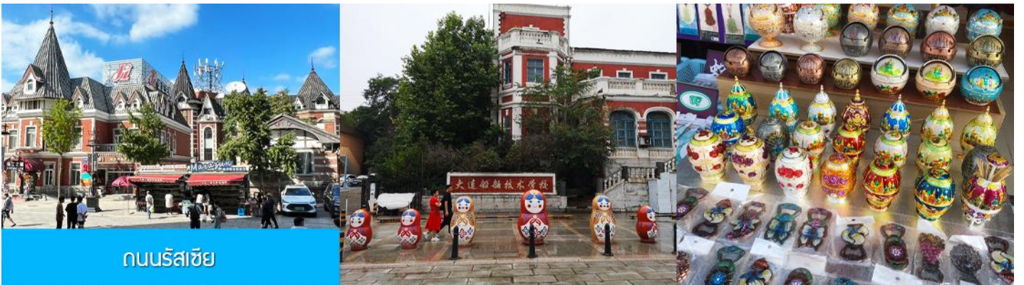
ถนนรัสเซีย