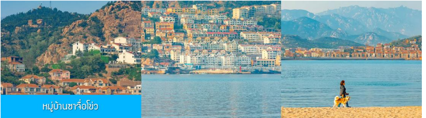
หมู่บ้านซาจื่อโข่ว

เช้า รับประทานอาหารเช้า ณ ห้องอาหารของโรงแรม (4)