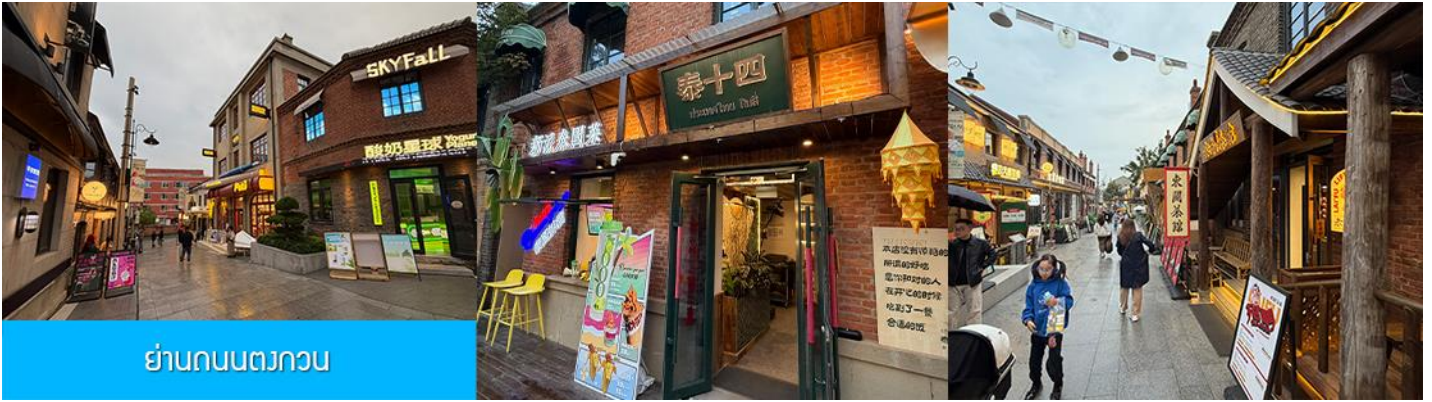
ย่านถนนตวงกวน

นำท่านเที่ยวชม จัตุรัสชิงไห่ 星海广场 เป็นจัตุรัสขนาดใหญ่เป็นแลนด์มาร์คสำคัญของเมืองต้าเหลียน สร้างขึ้นเพื่อเฉลิมฉลองในโอกาสที่รัฐบาลอังกฤษคืนเกาะฮ่องกงในให้จีนในปี ค.ศ. 1997 ตั้งอยู่ชายฝั่งทะเลในเมืองต้าเหลียน เป็นจัตุรัสใจกลางเมืองที่ใหญ่ที่สุดในโลกและเป็นแลนด์มาร์คของเมืองต้าเหลียน รายล้อมด้วยตึกกระจกฟ้าที่ทันสมัย ภายในมีบ่อน้ำพุดนตรี ลานหญ้าขนาดใหญ่ และลานกว้างสำหรับจัดกิจกรรมกลางแจ้ง อาทิ เทศกาลเบียร์นานาชาติ การแข่งขันวิ่งมาราธอน งานแฟชั่นนานาชาติเมืองต้าเหลียน ฯลฯ