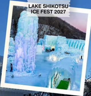
LAKE SHIKOTSU ICE FEST 2027