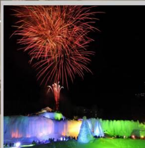
"SOUNKYO ICE FEST"