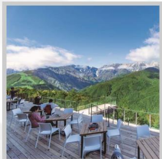
“HAKUBA MOUNTAIN HARBOR”

นำท่านไปไอบกอดธรรมชาติที่ครบครันในที่เดียว “คามิโคจิ” สวิสเซอร์แลนด์แดนญี่ปุ่นเทือกเขาที่ปกคลุมด้วยหิมะสวยงาม ชมความงามของ “ทุ่งพืชมอส ฟุจิชิบะซากุระ” มนต์เสน่ห์..พรมธรรมชาติสีชมพูหลากสีสดใส เปลี่ยนอิริยาบถ “ขึ้นกระเช้าฮาคุบะ อิวะตะกะ” เพื่อชมวิวพาโนรามาของเทือกเขาแอลป์ญี่ปุ่นกันให้อิ่มใจ สัมผัสกลิ่นอายเมืองเก่า “เมืองทาคายามา” ที่ยังคงอนุรักษ์ความเป็นอยู่ เมื่อสมัยเอโดะกว่า 300 ปี สายช้อปปิ้งห้ามพลาด “คารุอิซาวะ เอ้าท์เล็ต” แลนด์มาร์กของเมืองคารุอิซาวะ และ “ย่านชินจูกุ” แห่งเมืองโตเกียว ชมความงามกับเส้นทาง “เจแปนแอลป์ (กำแพงหิมะ)” สุดยอดของการท่องเที่ยวที่ถูกขนานนามว่า “หลังคาแห่งญี่ปุ่น”