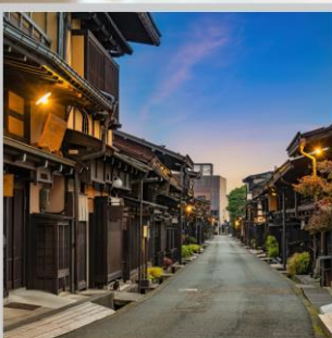
“TAKAYAMA OLD TOWN”