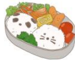
● อาหารสำหรับเด็ก ( 2-11 ปี ) *วัตถุประสงค์ขึ้นอยู่กับทาว์ราน