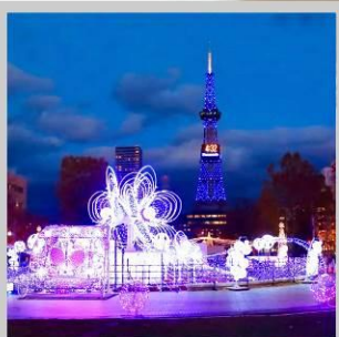
“SAPPORO WHITE ILLUMINATION”