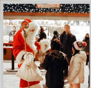
“ODORI GERMAN MARKET”