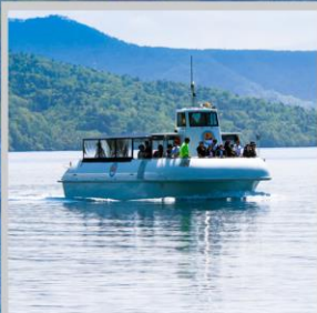
“LAKE SHIKOTSU GLASS BOAT”