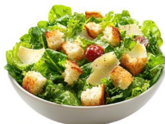
● ผักสดวิธีตี