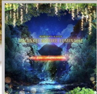
“JOZANKEI NATURE LUMINARIE”