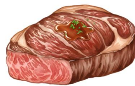
● ไม่ทานเนื้อหมู