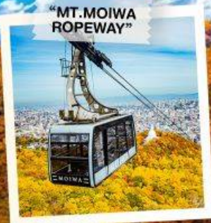
“MT. MOIWA ROPEWAY”