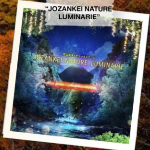
“JOZANKEI NATURE LUMINARIE”

วันเดินทาง 23 - 28 ต.ค. 2569 (วันปืยมหาราช) 28 ต.ค. - 2 พ.ย. 2569 30 ต.ค. - 4 พ.ย. 2569