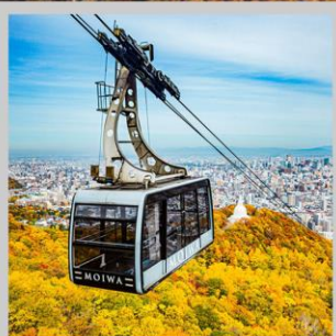
“MT. MOIWA ROPEWAY”