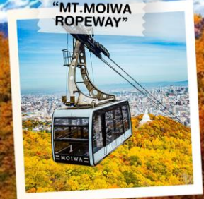
“MT. MOIWA ROPEWAY”