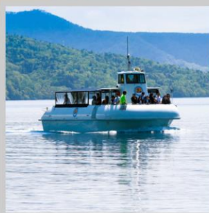
“LAKE SHIKOTSU GLASS BOAT”