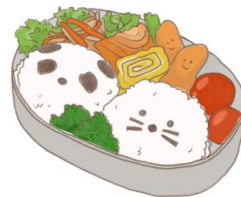
● อาหารสำหรับเด็ก ( 2-11 ปี ) *วัตถุประสงค์ขึ้นอยู่กับทาว์ราน