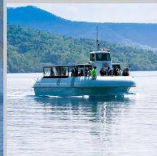
“LAKE SHIKOTSU GLASS BOAT”