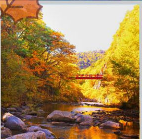
“JOZANKEI FUTAMI BRIDGE”