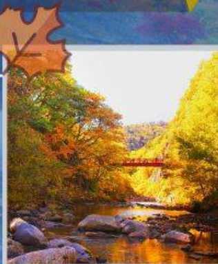
“JOZANKEI FUTAMI BRIDGE”