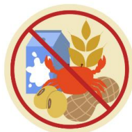
● แพ้อาหาร / อื่นๆโปรดระบุ