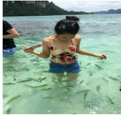
ชมทะเลแหวกUnseen in Thailand เชื่อมระหว่างเกาะทับ และเกาะหม้อ