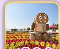
สวนซิกิโซโนะโอะกะ