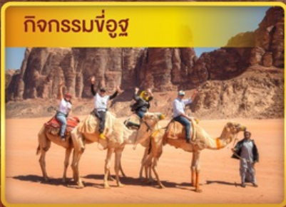
กิจกรรมขี่อูฐ