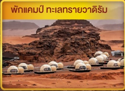
พักแคมป์ ทะเลทรายวาดีรัม