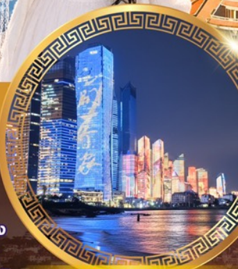
No.3 Bathing Beach

ลานจัดงานเบียร์ชิงเต่า Golden Beach ทางเดินไม้ริมทะเล ศาลเจ้าเทพทะเล ถนนคนเดินโกตง วัดไท่ชิงกง ซาโจโฮ่ว พิพิธภัณฑ์ชิงเต่า ซิกแนลฮิลล์ ถนนหลงเจียง สู่ ย่านหยินหยูเซียง ย่าน Da Bao island โบสถ์ st.Michael's Cathedral ถนนจงซาน ย่านปาต้ากวน จตุรัสเมย์โฝร์