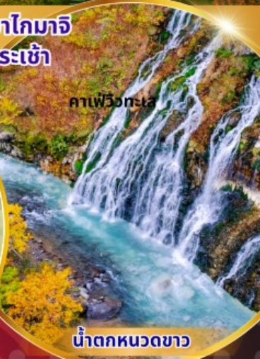
น้ำตกหมวดขาว

พักโรงแรม 3 ดาว ★★★★★ ฟรี ประกันอุบัติเหตุ บริการอาหารท้องถิ่น