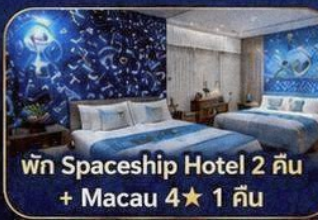
พัก Spaceship Hotel 2 คืน + Macau 4★ 1 คืน