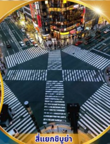
สีแยกชิบูย่า