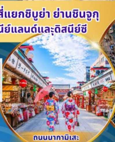
ถนนนากามิसे