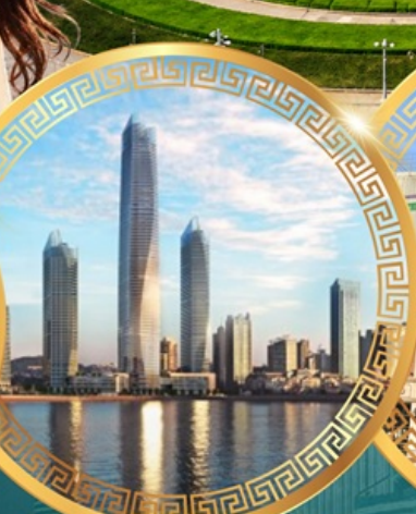
ชมวิวดาคารโซตัน เซ็นเตอร์