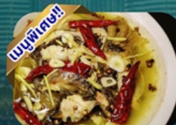
ปลาต้มผักกาดดอง