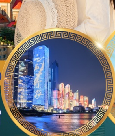
No.3 Bathing Beach

ลานจัดงานเบียร์ชิงเต่า Golden Beach ทางเดินไม้ริมทะเล ศาลเจ้าเทพทะเล ถนนคนเดินโตตง พิพิธภัณฑ์เทศบาลชิงเต่า สวนสาธารณะซิกแนลฮิลล์ ถนนหลงเจียงสู่ กระเช้าภูเขาไท่ผิง ยาน Da Bao island โบสถ์ st.Michael's Cathedral ถนนจงชาน ถนนคนเดินพิลาญย่วน จัตุรัสเมย์ไฟร์