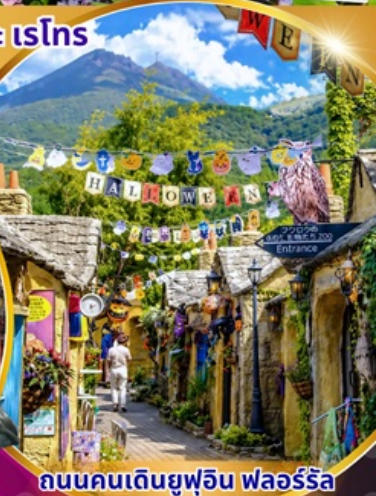
ถนนคนเดินยูฟูอิน ฟลอร์ริล