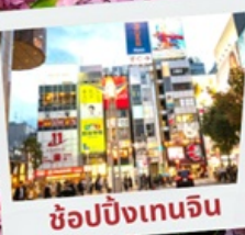
ช้อปปิ้งเทนจิน