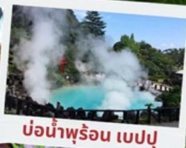
บ่อน้ำพุร้อน เบปปุ

หมู่บ้านยูฟูอินฟลอร์ริล ทะเลสาบคินริน ทะเลสาปคินริน บ่อน้ำพุร้อน อุมิจิโกกุ ท่าเรือโมจิโกะ เรโร ตลาดปลาคาราโตะ ศาลเจ้ามียาจิดาเกะ ดิวตี้ฟรี ฟุกุโอกะ เบย์ พลาซ่า ช้อปปิ้งออน มอลล์ หิ้งคูเมโอโตะอิวะ ชมดอกไม้ไฮเดรนเยีย รอนน้ำตกชิราอิโตะ ช้อปปิ้งย่านเท็นจิน