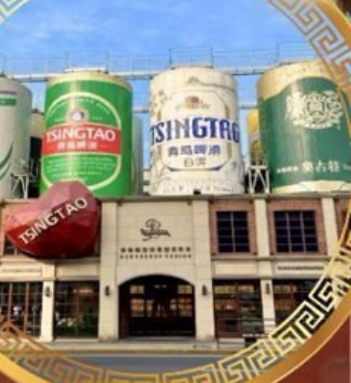
โรงงานเบียร์ชิงเต่า