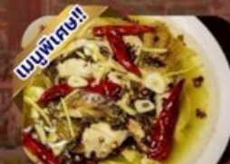
ปลาต้มพริกทอด