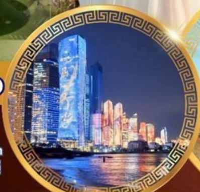
No.3 Bathing Beach

ลานจัดงานเบียร์ชิงเต่า Golden Beach ทางเดินไม้ริมทะเล ศาลเจ้าเทพทะเล ถนนคนเดินโตตง พิพิธภัณฑ์เทศบาลชิงเต่า สวนสาธารณะซิกแนลฮิลล์ ถนนหลงเจียงสู่ กระเช้าภูเขาไต้ผิง ยาน Da Bao Island โบสถ์ st.Michael's Cathedral ถนนจงชาน ถนนคนเดินฟิลาญย่วน จัตุรัสเมย์ไฟร์