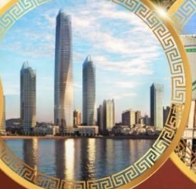
ชมวิวดาคารโฮตัน เซ็นเตอร์