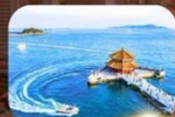
สะพานฉันเจียว

พักโรงแรม 4 ดาว ★★★★★ ฟรี ประกันอุบัติเหตุ บริการอาหารท้องถิ่น