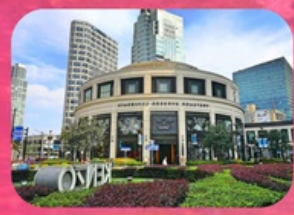
สตาร์บิคใหญ่ที่สุดในเอเชีย