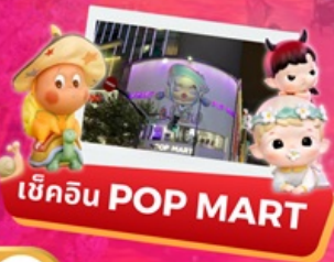
เข้คิน POP MART