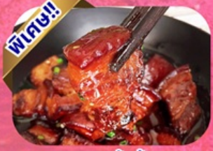
เมนูหมูสามชั้นน้ำแดง

พักโรงแรม 4 ดาว ★★★★★ ฟรี ประกันอุบัติเหตุ บริการ อาหารท้องถิ่น