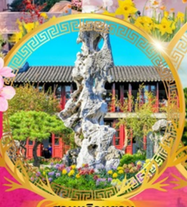
สวนหลิวหยวน

ถนนหนานจิงสู่ หาดไว่ทวน ชมหอไข่มุก วัดหนานซาน ถนนโบราณซีหลี่ซานถิง ช้อปปิ้งถนนกวนเจียนเจีย ตำนานนางพญาซิวา เจดีย์เหลยเฟิง เขคินย่านเก่าซันเทียนตี้ สักการะศาลเจ้าพ่อหลี่กั๋วเม้ง