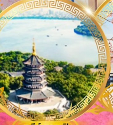
เจดีย์เหลยเฟิง